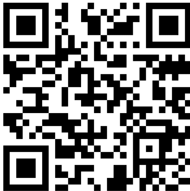
QR Code การประชุมคณะกรรมการด้าน ITA