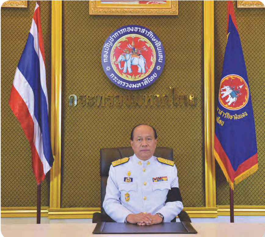
นายกองใหญ่ อนุพงษ์ เผ่าจินดา ผู้บัญชาการกองอาสารักษาดินแดน