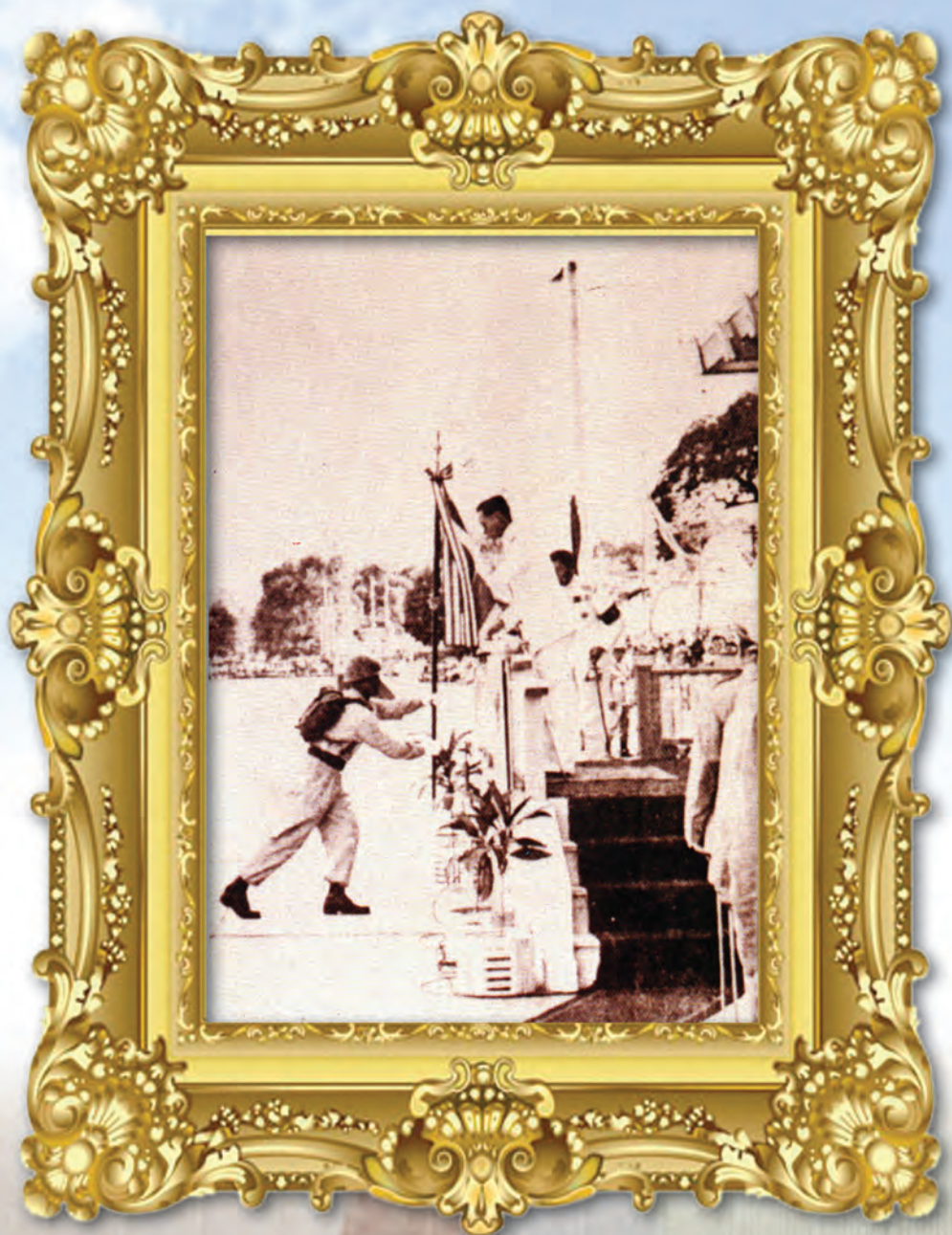
รับพระราชทานธงประจำกอง กองอาสารักษาดินแดน