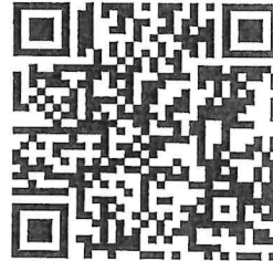
QR Code รายละเอียดหลักสูตรเพิ่มเติม