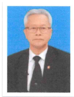
๒.นายธวัชชัย ไทยเขียว อดีตอธิบดีกรมพินิจคุ้มครองเด็กและเยาวชน อดีตรองปลัดกระทรวงยุติธรรม