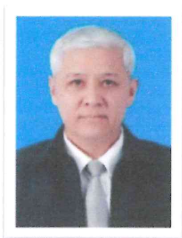
๔.พล.ต.ท.ปัญญา เอ่งฉ้วน อดีต ผบช.กมค.