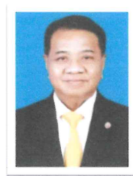
๙. พล.ต.อ.วิเชียร พงษ์โพธิ์ศรี อดีต ผบ.ตร. , อดีตเลขาธิการ สมช. อดีตปลัดกระทรวงคมนาคม