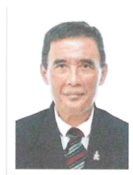
๖.พล.ต.ท.อำนาจ นิ่มมะโน อดีต ผบช.ภ.๑