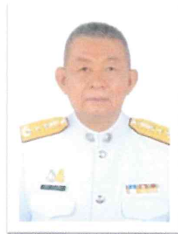
๑๔. พล.ต.ท.เสถียร คุวิบูลย์ศิลป์ อดีตผู้ทรงคุณวุฒิพิเศษ ตร.