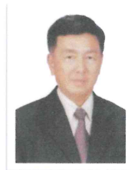
๓.พล.ต.อ.ชัยยง กীরติขจร อดีต รอง ผบ.ตร.