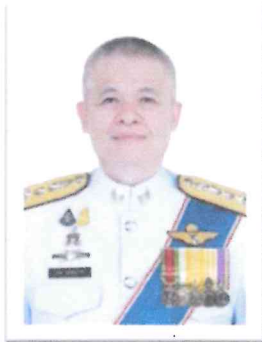
๑.พล.ต.ท.กมล เจริญรักษา อดีตผู้ทรงคุณวุฒิพิเศษ ตร.