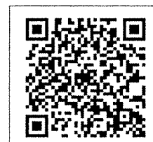
QR-Code เพื่อสอบถาม