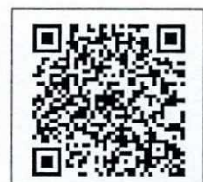
QR-Code เพื่อสอบถาม