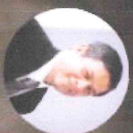
ท่านไพโรจน์ ภูมเด่น

อธิการบดีมหาวิทยาลัยราชภัฏวชิรเวศน์ ปทุมธานี และอดีตนายกสภา อธิการบดี มหาวิทยาลัยราชภัฏวชิรเวศน์ และอดีตนายกสภา มหาวิทยาลัยราชภัฏวชิรเวศน์