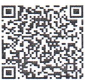
เอกสารแนบ