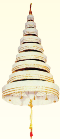
พระมหาเศวตฉัตร (มะ-หา-สะ-เหวด-ตะ-ฉัตร) หรือ พระนพปฎลมหาเศวตฉัตร (นพ-พะ-ปะ-दन-มะ-หา-สะ-เหวด-ตะ-ฉัตร)

บทความนี้ ขอแสดงความหมายและส่วนประกอบของสิ่งสำคัญยิ่งที่ต้องทูลเกล้าฯ ถวายในการพระราชพิธีบรมราชาภิเษก เพราะเป็น “เครื่องหมายแห่งความเป็นพระราชาธิบดี” นั่นคือ เครื่องราชกกุธภัณฑ์ (ราด-ชะ-กะ-กุด-ทะ-พัน) ประกอบด้วย พระมหาเศวตฉัตร พระมหาพิชัยมงกุฏ พระแสงขรรค์ชัยศรี ธารพระกร วาลวิชนี และฉลองพระบาทเชิงงอน