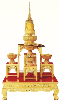
เครื่องเบญจราชกกุธภัณฑ์

เป็นฉัตร 9 ชั้น หุ้มผ้าขาวมีระบาย 3 ชั้น ขลิบทองแผ่ลวดมียอด ชั้นล่างสุดห้อยอุบะจำปาทอง สำหรับพระมหากษัตริย์ที่ทรงรับพระบรมราชาภิเษกแล้ว ใช้แขวนหรือปักเหนือพระราชอาสน์ราชบัลลังก์ในท้องพระโรงพระมหาปราสาทราชมณเฑียร ถือเป็นเครื่องราชกกุธภัณฑ์ ที่สำคัญยิ่งกว่าราชกกุธภัณฑ์อื่นๆ