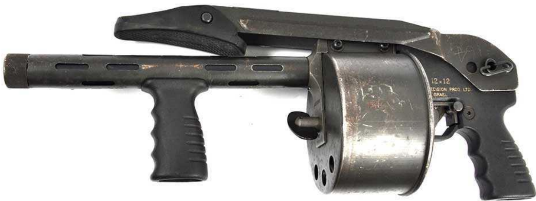
ลูกซองแบบงานกระสุน 12 นัด

ความงงในขนาดของปืนลูกซองนับว่างงในระดับหนึ่งแล้ว (ความเดิมตอนที่แล้ว) ความงงในการอนุญาตให้มีและใช้ปืนลูกซองในบ้านเรายิ่งงงกว่า เนื่องด้วยเราระบุจำนวนกระสุนไว้ในใบอนุญาตด้วย เช่น เดี่ยวลูกซอง 5 นัด เดี่ยวลูกซอง 8 นัด เป็นต้น ในขณะที่ปืนอื่น ๆ เรามิได้ระบุจำนวนกระสุนไว้เลย เช่น ปืนลูกโม้ มีตั้งแต่ 5 นัด ถึง 10 นัด เราก็มิได้ระบุว่าลูกโม้กี่นัด หรือปืนกึ่งอัตโนมัติที่มีขนาดความจุกระสุนตามช่องกระสุน ตั้งแต่ 6 นัด ถึง 100 นัด เราก็มิได้ระบุจำนวนกระสุนไว้เลย แล้วทำไมปืนลูกซองเราต้องระบุ “เดี่ยวลูกซอง 5 นัด” หรือ “เดี่ยวลูกซอง 8 นัด”