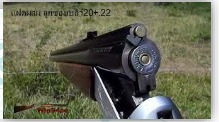
แฝดผสม ลูกซองเบอร์ 20+ 22