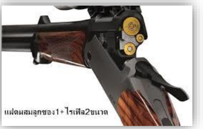
แฝดผสมลูกซอง 1+ ไรเฟิล 2 ขนาด

“ลำกล้องผสม” ครับ ไม่ใช่ “แฝดลูกซอง” แก้ไขชนิดและขนาดให้ถูกต้องด้วยครับ