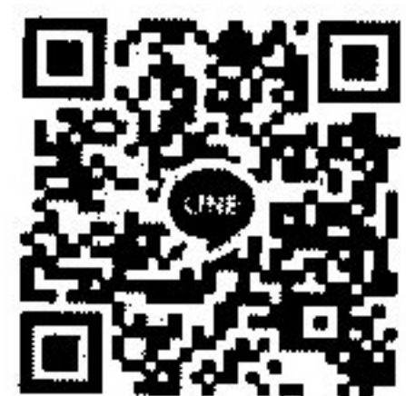
กลุ่มที่ ๑