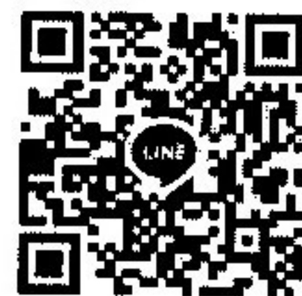
กลุ่มที่ ๒