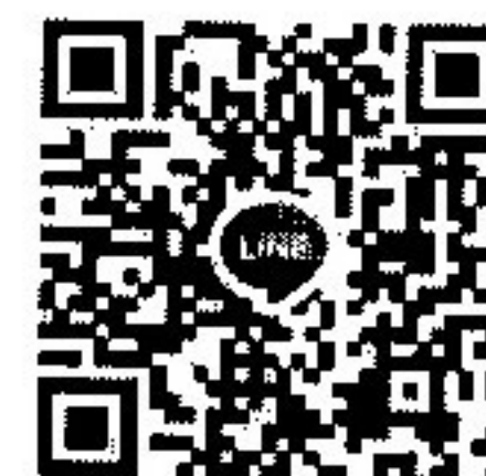
กลุ่มที่ ๓