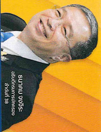
นายจกสจก อธิบดีกรมการปกครอง ตำแหน่งที่ 38

“หน้าที่ของฝ่ายปกครอง คือ ทำให้ประชาชน ทุกข์น้อยลง สุขมากขึ้น”