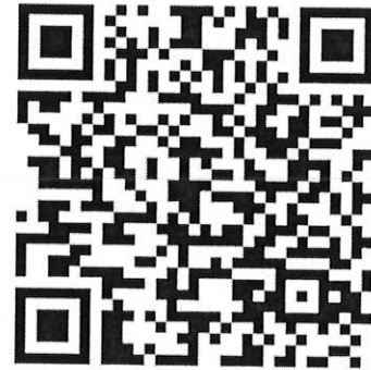
สิ่งที่ส่งมาด้วย ๔

ทั้งนี้ สามารถดาวน์โหลดเอกสารทั้งหมดได้จาก เว็บไซต์ กองวิชาการและแผนงาน