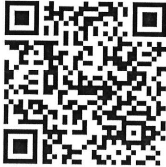
สิ่งที่ส่งมาด้วย ๑

ตามหนังสือกรมการปกครอง ด่วนที่สุด ที่ มท ๐๓๐๕.๑/ว ๘๔๔๔ ลงวันที่ ๒๘ มีนาคม ๒๕๖๓ เรื่อง ชักซ้อมแนวทางการดำเนินโครงการสนับสนุนการบูรณาการและการขับเคลื่อนนโยบายในระดับอำเภอ ประจำปีงบประมาณ พ.ศ.๒๕๖๓ กรณีการป้องกันและลดความเสี่ยงในการแพร่ระบาดของ โรคติดเชื้อไวรัสโคโรนา 2019