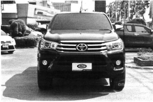
ตัวอย่างที่ ๔ รูปภาพด้านหน้า,ด้านหลัง,ด้านซ้าย,ด้านขวา