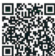
ตราสัญลักษณ์ ๗๐ ปี ไทย - กัมพูชา