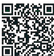
ตราสัญลักษณ์ ๗๐ ปี ไทย - ลาว