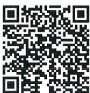
รายงานผลการดำเนินโครงการ